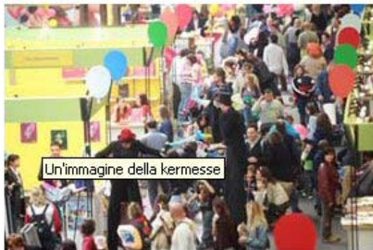
Un'immagine della kermesse

Modena, 27 marzo 2008 - Inaugura domani, venerdì 28 marzo, "Children's Tour", il Salone delle Vacanze da 0 a 14 anni in programma a Modena nel quartiere fieristico. Una kermesse dedicata ai viaggi e all'intrattenimento dei più piccoli, all'interno della quale troveranno però spazio anche i temi dell'ambiente e della salute.